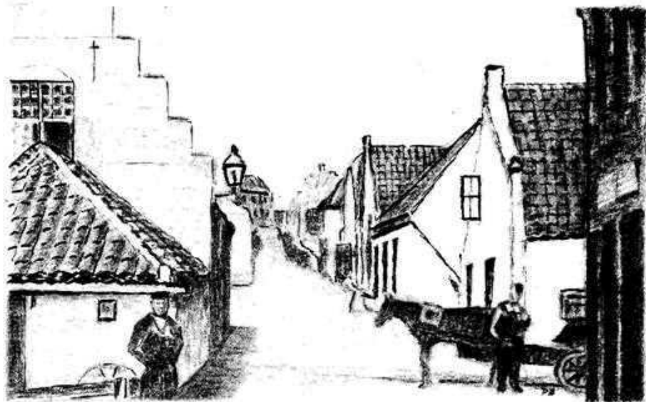
Rozenobelstraat omstreeks 1910 -

Voor eventuele reacties op artikelen als deze houden wij ons aanbevolen. Vooral anekdotische verhalen hebben onze belangstelling ! --