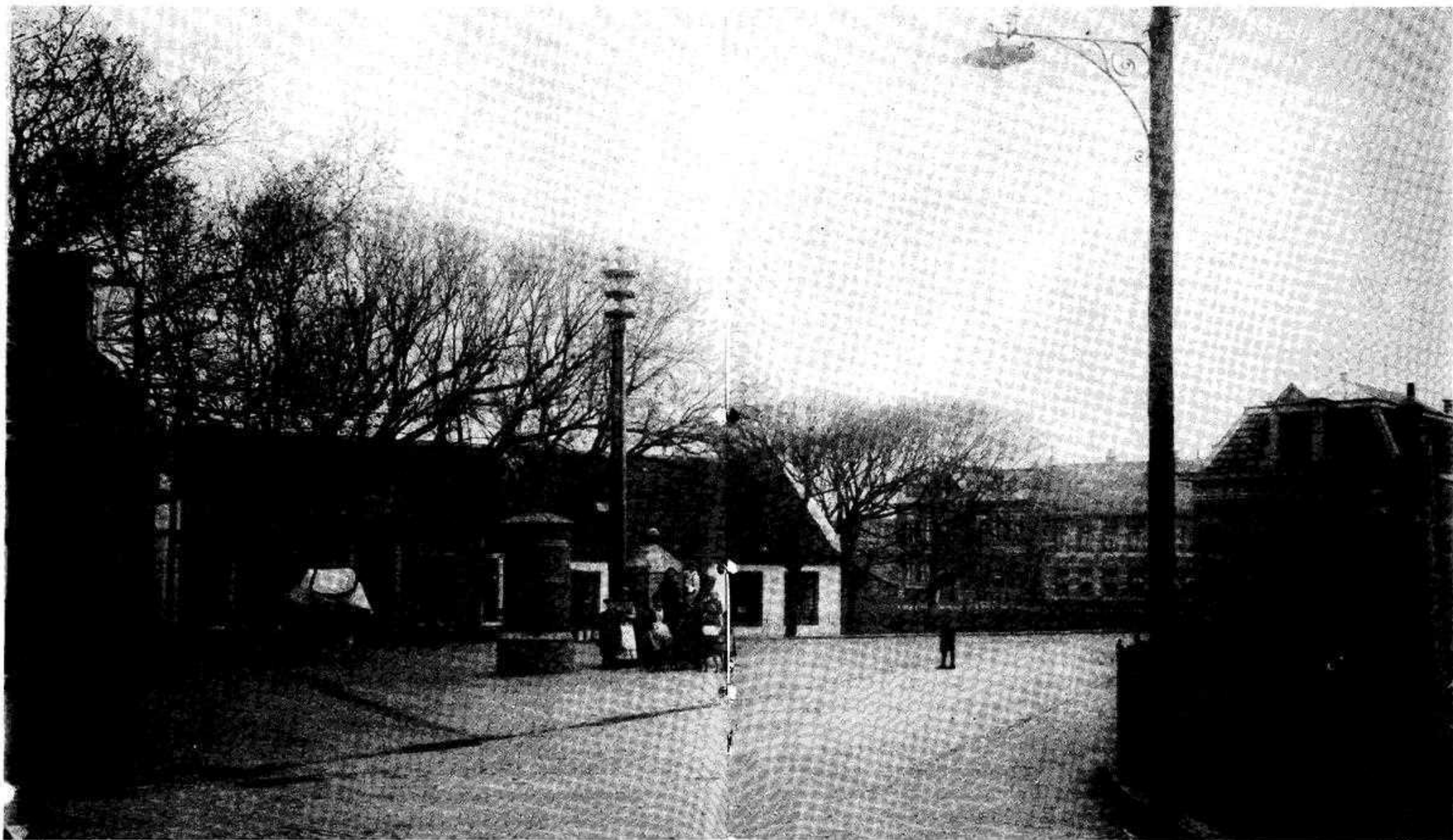
Kerkplein omstreeks 1906 - Wij putten nog weer even uit onze collectie "Schenkingen". Wat zou de fotograaf bewogen hebben dit beeld vast te leggen? Zou hij ook aan latere generaties hebben gedacht om hen een indruk te geven hoe de dorpsituatie zich ook hier ging wijzigen, mede onder invloed van de

ontwikkelingen die de badplaats in het begin van deze eeuw doormaakte? Mocht dit zo zijn, dan is hij daarin o.i. bijzonder goed geslaagd. Want getuigt de paal op de voorgrond niet van de nieuwe dingen: o.a. de plaats gehad hebbende electrificatie van Zandvoort, waarmee wellicht ook de paal